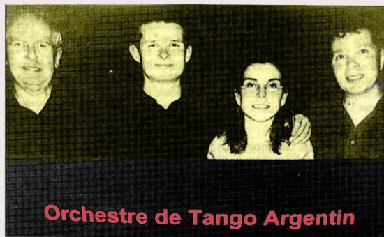
Orchestre de Tango Argentín

À la fin du 19 ème , lorsque les faubourgs puis les salons bourgeois parisiens adoptèrent le tango, les Argentins qui trouvaient dans un premier temps cette musique bien trop populaire se montrèrent rapidement fiers d'en être les créateurs. C'est à Carlos Gardel que l'on doit cette ascension sociale, sans oublier Osvaldo Pugliese et Annibal Troilo qui, influencés par la musique classique et le jazz, enrichirent ses arrangements. Le tango doit son origine à la tradition créole, mais également à de nombreuses influences culturelles immigrantes.