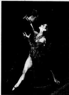
Une danse devenue le symbole d'une Argentine en plein désarroi.

La Traversa prend le large le 5 décembre avec le Quatuor Tango Nuevo, quatre jeunes musiciens reprennent et donnent vie à la musique d'Astor Piazzolla. La voix centrale reste le bandonéon autour de la contrebasse, piano et violon. Toute l'histoire de l'Argentine et derrière elle, Astor Piazzolla transpirent dans un ouragan de notes, de tempos et d'émotion. Une semaine plus tard, la danse se mêle à la musique à Aix-les-Bains avec Tango Pasion. Un spectacle brûlant d'émotions où désir, jalousie, solitude, tristesse, vanité s'estom-