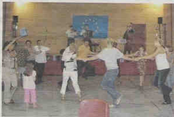
A une semaine des élections européennes, on a célébré l'Europe avec enthousiasme à Cessy...

Les trois musiciens professionnels de grand talent du Trio Czardas, originaires de Rhône-Alpes, ont interprété à l'accordéon, au violon et à la contrebasse les plus beaux airs des pays de l'Est de l'Europe et animé cette soirée conviviale.